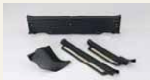
エコプラスチック製射出材を活用した内装部品

従来の表皮材は、基材と表皮を張り合わせて加熱した後でプレス成形します。エコプラスチック表皮材は、繊維の融点が低いため、その工法では成形し難いことが判明しました。そこで新たに基材加熱後に表皮を張り合わせる「後張り工法」を開発し、従来と変わらぬ性能、風合いを出すことに成功しました。また、エコプラスチック製射出剤は、従来のものより流動性が低いため、型の構造そのものから新しく開発しました。