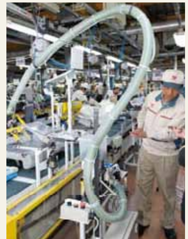
ホースの中を通過して、使う分だけのクリップが空気圧で送り出されていく

でも一番私の心をつかんだのは、クリップを使う分だけ空気で送り出す装置を見たとき。ホースの中を踊りながら飛んでいく動きのおもしろさとアイデアにすっかり魅了されてしまいました。つくったのは、今もお少年のような遊び心を持った人たちなのでしょうね。