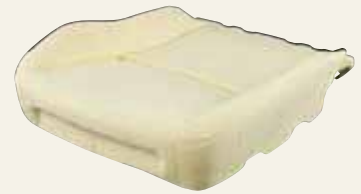
植物由来材料を用いた自動車用クッション

「ひまし油」を分子レベルでポリオールに近い構造へと変性させる技術を用いて、自動車用シートに要求される反発弾性、耐久性を実現しました。