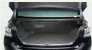
エコプラスチック製表皮材を活用したラゲージルーム

PET(ポリエチレンテレフタレート)の一部をポリ乳酸に置き換えた射出材を活用し、ラゲージ廻り(ラゲージトリム)を開発しました。エコプラスチックに最適な製品工法、製品形状、成形条件を確立することで、従来品と同等の性能・品質・風合いを確保しました。